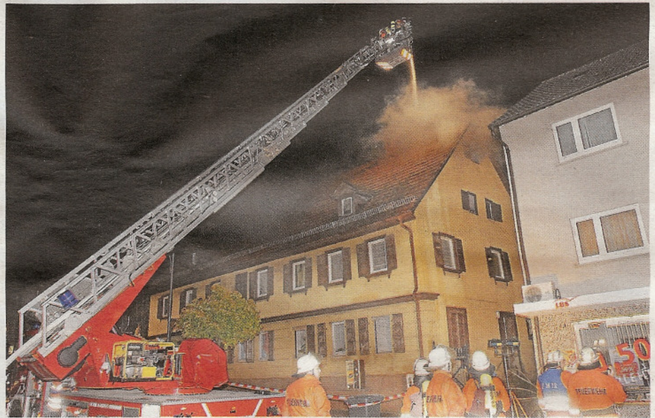
2008: Brand in der Esslinger Straße. Die Feuerwehr konnte ein Übergreifen des Brandes auf andere Gebäude verhindern.

Obwohl die Idealstärke der Aktiven mit gewünschten 90 Mitgliedern nicht erreicht werden konnte, sei die Wehr fit für jeden Ernstfall, betonte Maurer: „Die Bürger können sich rund um die Uhr an 365 Tagen im Jahr auf die schnelle und effektive Hilfe bei Bränden und Notlagen verlassen.“ Im kommenden Jahr,